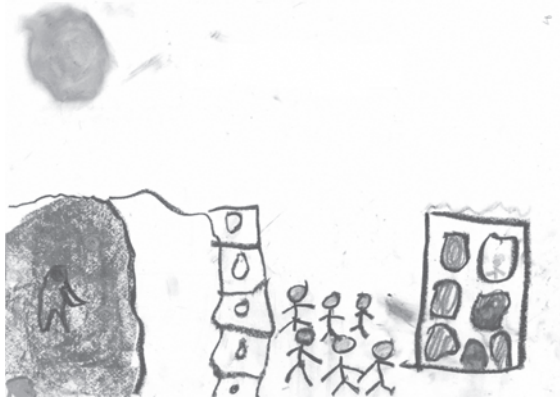
Dibujo 6. PERSECUCIÓN: defensas y esperanza