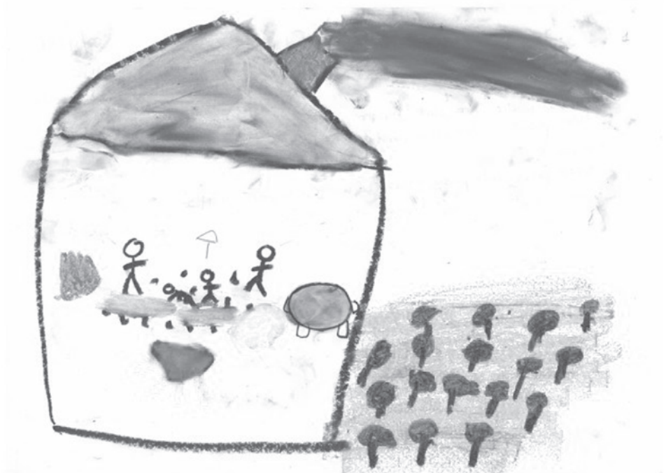
Dibujo 1. Escena de Violencia. Habitual en la familia.

A menudo dibuja y verbaliza escenas de violencia entre los padres, ella está en medio y el padre aparece como el violento.