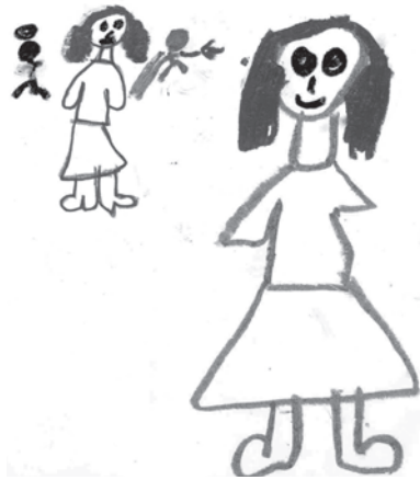
Dibujo 5. Ambivalencia e Integración

Dibujo realizado en una sesión representativa de muchas otras. Psicóloga y nena hablan de algunas escenas que se han dado en la Casa en las que Loli mostraba una actitud violenta hacia su madre.