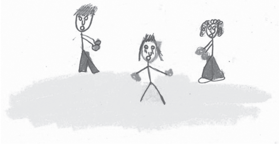
Dibujo 2. Violencia. Control y adaptación

Situación y expresiones muy gráficas. La figura del medio la representa, mostrándose, como siempre, inmersa en las disputas y violencia de los padres. Los brazos abiertos para separar y evitar enfrentamientos. Las manos como puños muy remarcados. El rostro del hombre expresa enfado y ella se dibuja llorando.