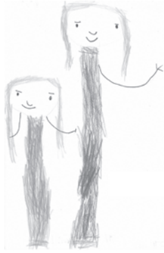
Dibujo 3. Precariedad del vínculo

Habitualmente cuando dibuja a la madre o escenas entre las dos omite las manos, o las dibuja significativamente frágiles. Las manos son las partes del cuerpo que dan y reciben, y desgraciadamente en estos casos también golpean. Símbolo de vínculo y relación.